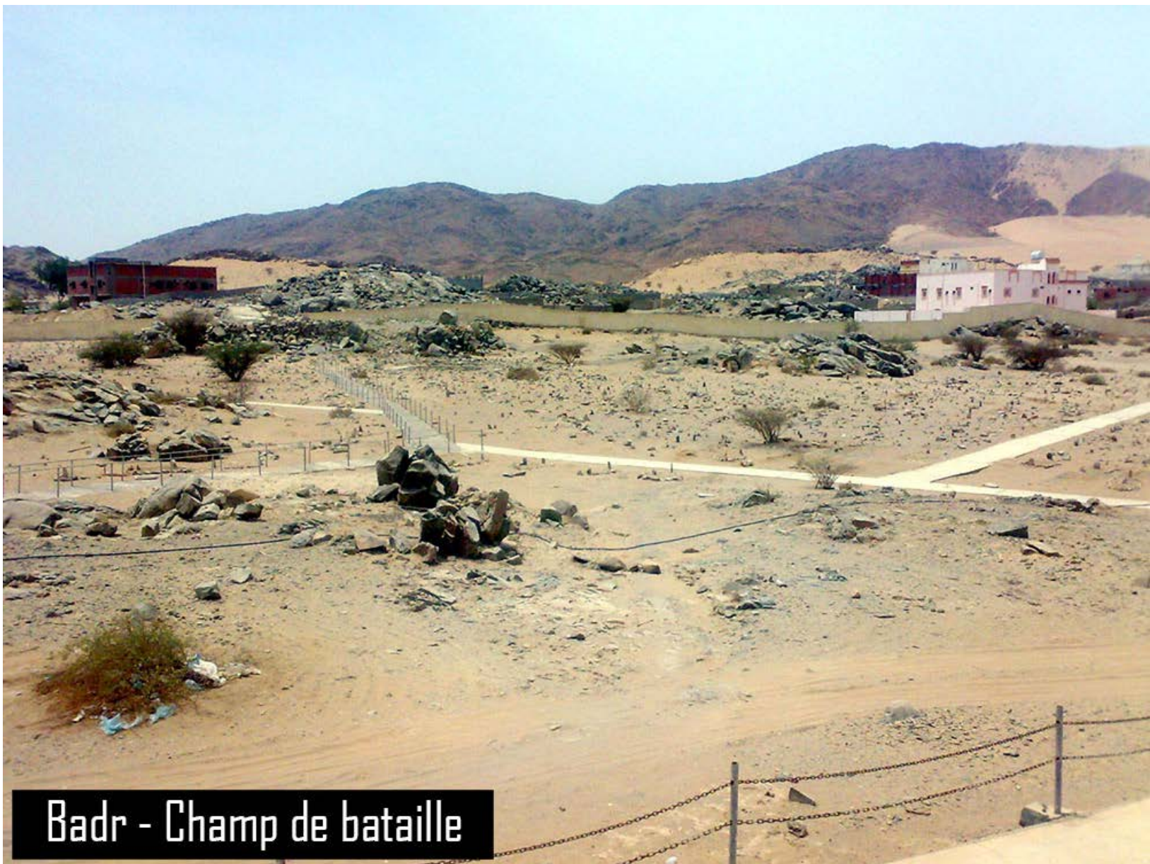
Badr - Champ de bataille