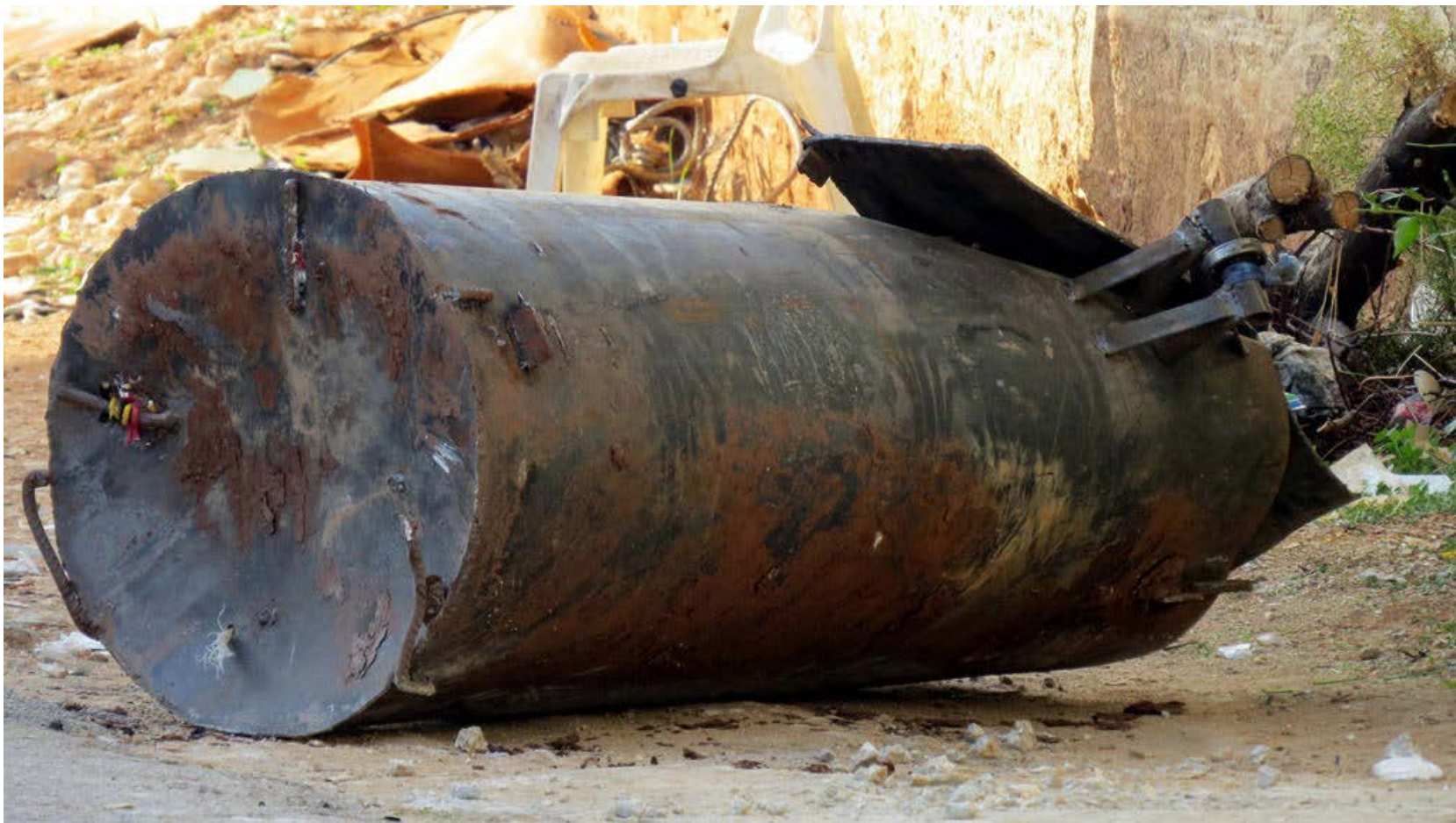
Barmil - Barrel bomb